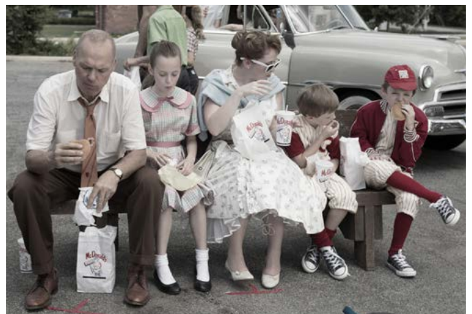
© Splendid – „The Founder“ USA 2016

Alle Burger auf Wunsch auch mit Brioche A,G1,H -Brötchen erhältlich